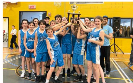
Les Dragons de Saint-Barthélemy ont remporté la première place de la division Louis Grenier-Sylvain Goyette.