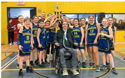
C'est l'école Dominique-Savio qui a mis la main sur le titre dans la catégorie Hassan Laramée.

Mentionnons que cet événement annuel, qui clôture la saison de mini-basket, a réuni plus de 200 jeunes des différentes écoles primaires de la région.