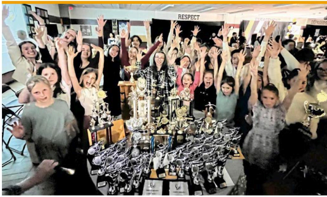
La table du CPA Magog était remplie de trophées au terme du gala régional du 13 avril dernier.