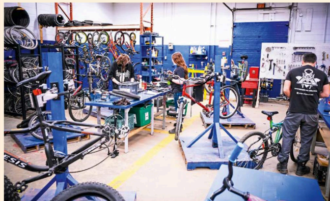
Entre 60 et 100 vélos reconconditionnés seront offerts lors de cette vente organisée par le CFER.

Notons qu'en parallèle des vélos, des élèves oeuvrant à l'atelier textile du CFER vendront aussi quelques-unes de leurs réalisations le 11 mai, dont des sacs réutilisables, des napperons, des sacs à vin, des tampons démaquillants ainsi que des sacs de motricité.