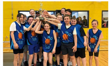
Dans la division Serge Gaudreau, le trophée a été remporté par l'école Saint-Jean-Bosco.