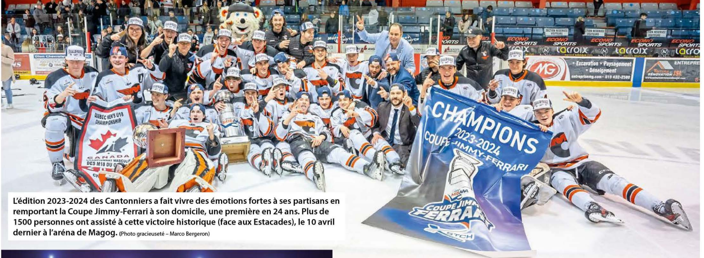
L'édition 2023-2024 des Cantonniers a fait vivre des émotions fortes à ses partisans en remportant la Coupe Jimmy-Ferrari à son domicile, une première en 24 ans. Plus de 1500 personnes ont assisté à cette victoire historique (face aux Estacades), le 10 avril dernier à l'aréna de Magog.