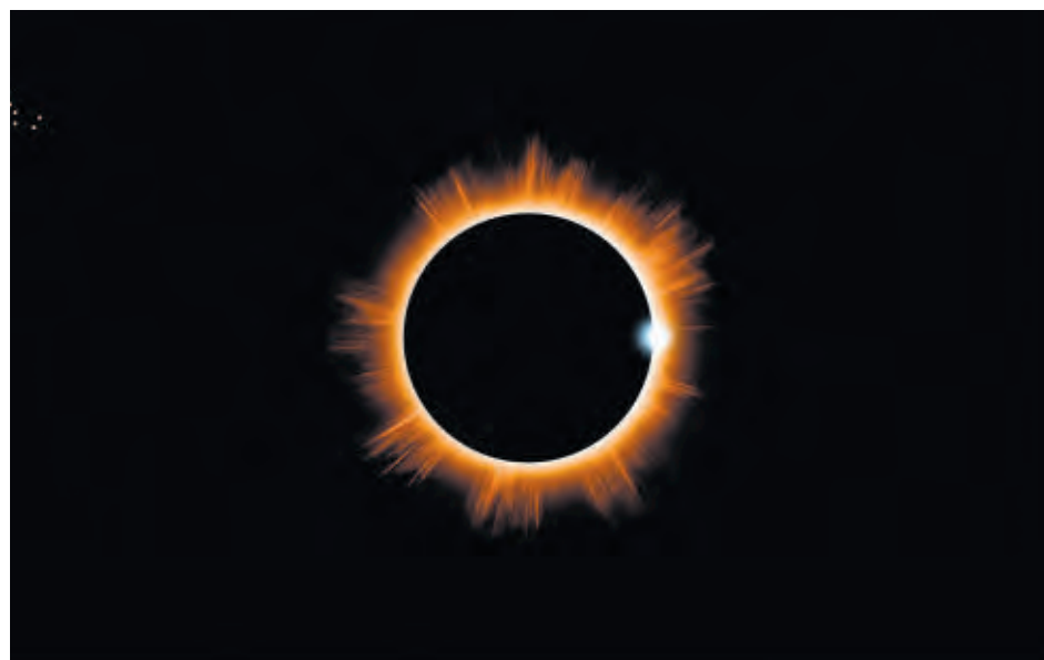
Le Centre de service scolaire des Sommets a imposé une journée pédagogique lors de l'éclipse du 8 avril.

En ce qui concerne les écoles secondaires, le Tournesol, offrira différentes activités et présentations sont réalisées en classe par des invités et les enseignants sur le sujet. Pour l'école l'Odyssée à Valcourt tiendra des activités qui sont organisées par le département des sciences. Des élèves en science et technologie y participeront. Les membres du personnel et leur famille sont aussi invités.