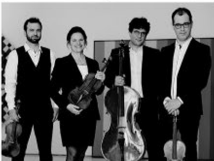
QUATUOR MOLINARI CLASSIQUE 06 AVRIL - 34$