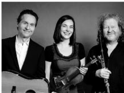
SOLSTICE + ROAD TO CONNOLLY CELTIC KITCHEN PARTY 16 MARS - 30$/15$