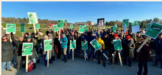
Plusieurs employés de l'École secondaire de La Ruche se sont fait voir et entendre sur le boulevard des Étudiants, à Magog, lors de cette mobilisation.

À moins d'une entente avec le gouvernement, les infirmières seront également en grève les 8 et 9 novembre.