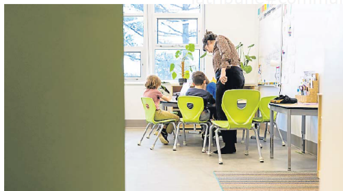
Quelque 80 élèves fréquentent l'école primaire du Solstice cette année.

Une soirée d'information en vue de la prochaine année scolaire a lieu le 28 novembre.