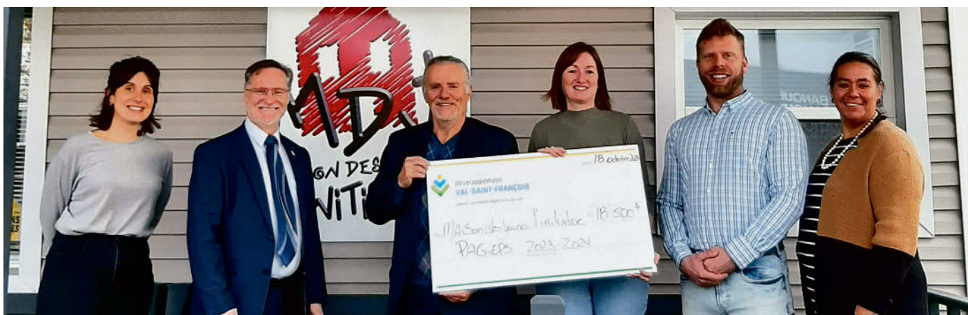
La Maison des jeunes L'Initiative de Valcourt réalisera un projet novateur qui touchera les jeunes et les familles du territoire de Valcourt.

Consultez le site Web pour en savoir plus : www.val-saint-francois.qc.ca .