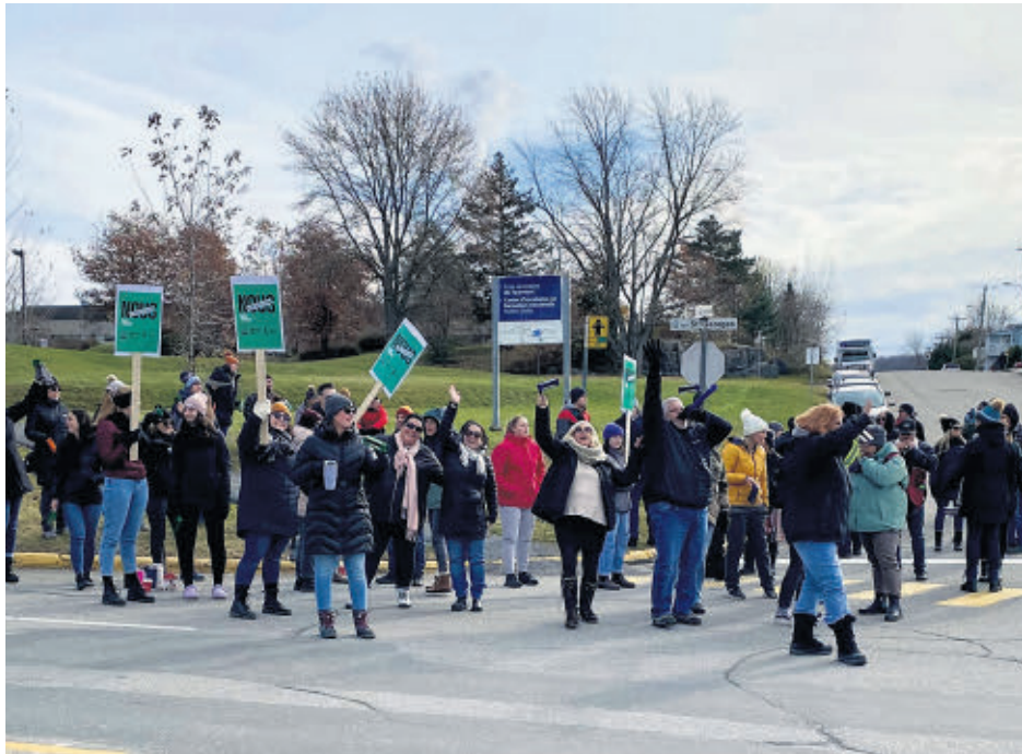
Lors de notre passage, plusieurs automobilistes klaxonnaient en guise de soutien aux employés syndiqués.

« Cela dit, il faut bien comprendre que ce mouvement est une démonstration de la détermination de nos membres, qui ont voté à 95 % en faveur de la grève et qui sont prêts à aller jusqu'au bout, jusqu'à la grève générale illimitée, si le gouvernement ne comprend pas le message » a tenu à dire le porte-parole du syndicat.