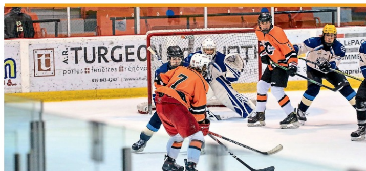
Le Challenge Kia se déroule du 6 au 18 décembre.

Notons que les joutes face au Collège Esther-Blondin et Trois-Rivières compteront aussi pour le classement de la saison régulière.