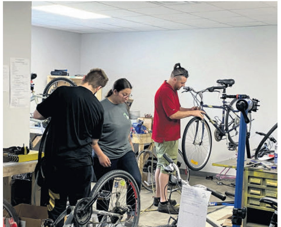
Ils sont trois à travailler sur le plateau de la rue Saint-Georges à Windsor.