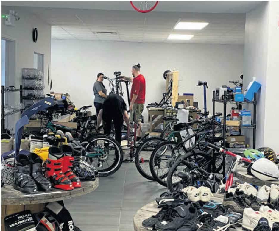
Environ 750 000 livres d'acier et d'aluminium ont évité les sites d'enfouissement.