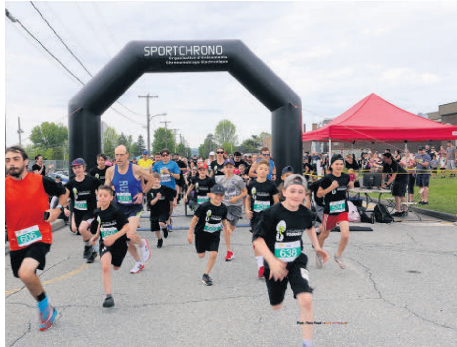
Pas moins de 400 personnes ont pris part à la huitième Course du Tournesol.