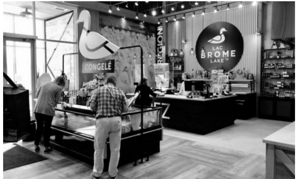
Canards du Lac Brome confirme également que tous les produits offerts en vente au détail ou au sein du secteur des services alimentaires sont sains et sans aucun danger pour la consommation.