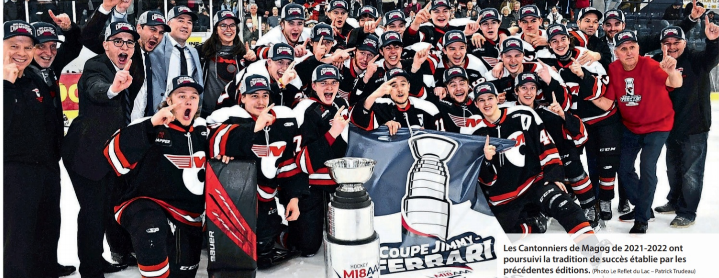
Les Cantonniers de Magog de 2021-2022 ont poursuivi la tradition de succès établie par les précédentes éditions.