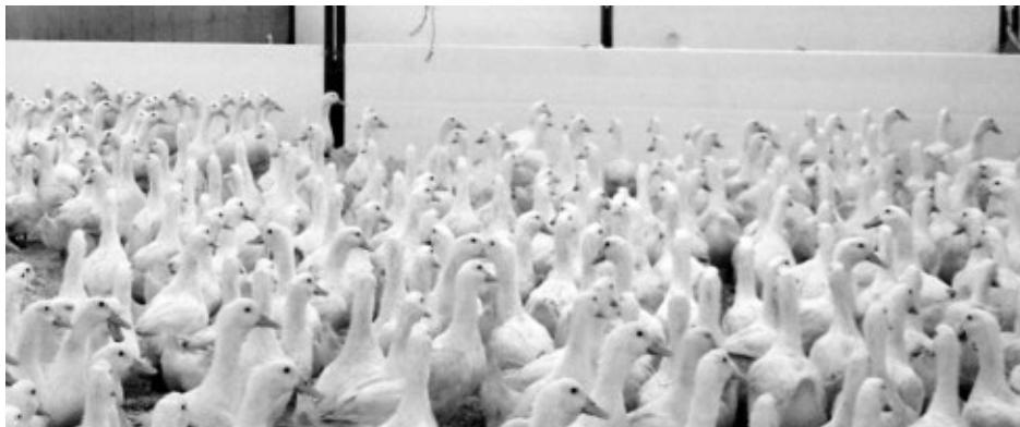
Les installations de Saint-Claude comptent pas moins de 100 000 canards.

importante que tout ce que nous avons surmonté jusqu'ici et on ne pourra pas le faire seul. Si le Québec et le Canada souhaitent maintenir cette industrie phare du secteur de l'agriculture et éviter que nous devenions totalement dépendants des importations à très court terme, nous levons la main et nous sommes prêts à mettre les efforts nécessaires. Mais nous ne pourrions le faire seuls, la marche est trop haute et ce n'est que collectivement que nous pourrions relancer ce secteur qui a fait ses preuves en termes de retombées », affirme la directrice générale.