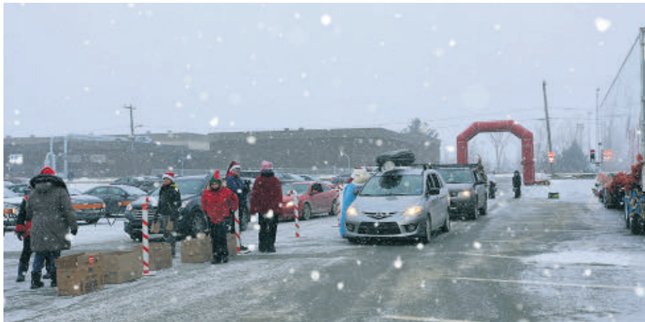
Pas moins de 194 voitures, comprenant 419 enfants et 208 adultes, sont passées voir le Père Noël cette année.