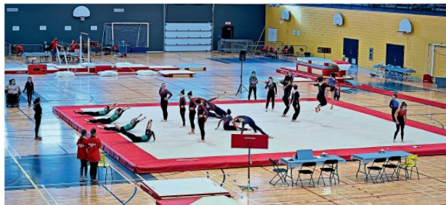
C'est au Centre sportif La Ruche qu'avait lieu le retour à la compétition « en présentiel » pour les gymnastes québécoises.